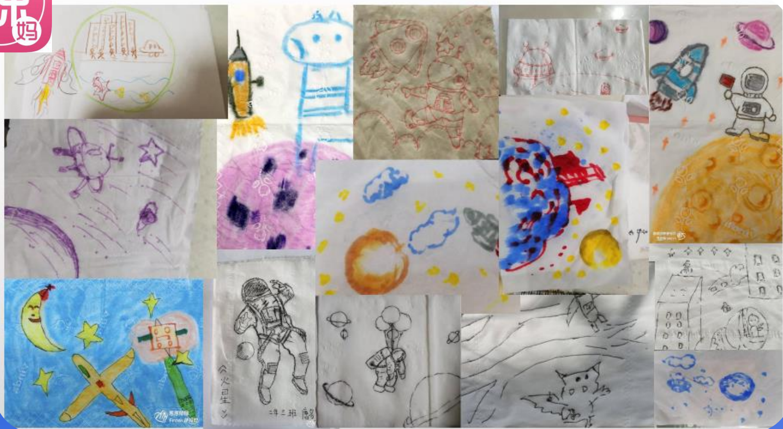
部分优秀纸巾画作品呈现