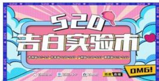
告白实验市线下活动