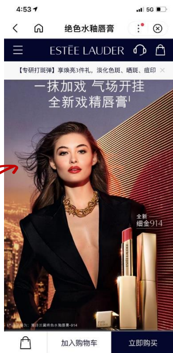
雅诗兰黛百度小程序 口红商品区