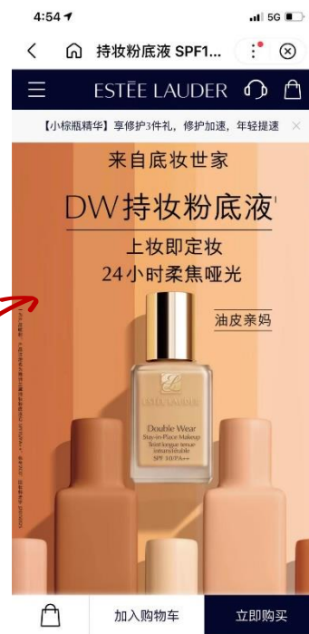
雅诗兰黛百度小程序 粉底商品区