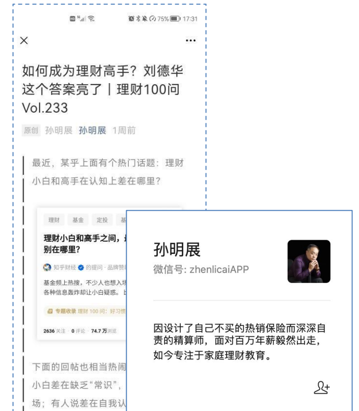
财经自媒体引用本次商业提问