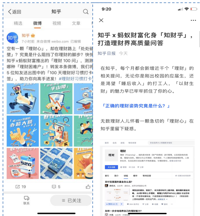
818当天知乎官方双微发布