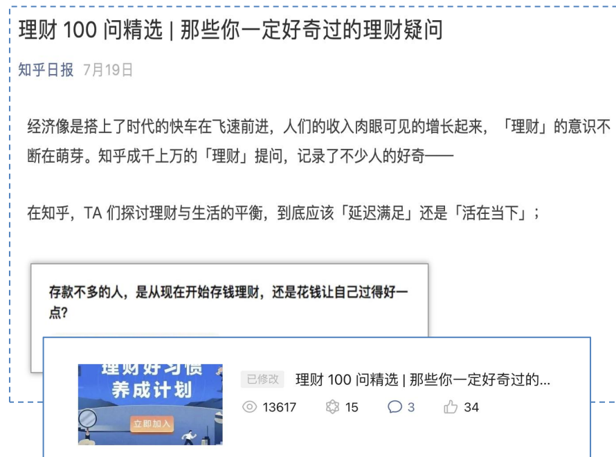
718知乎官方微信号发布